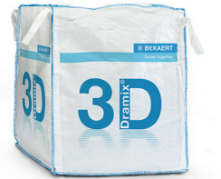
BÜYÜK TORBA 800 - 1.100 kg