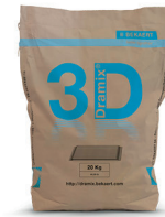
TORBA 20 kg